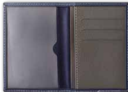
FOLIEN- & BLINDPRÄGUNG

Bei allen Modellen: Veredelungen kombinierbar! (Preis auf Anfrage)